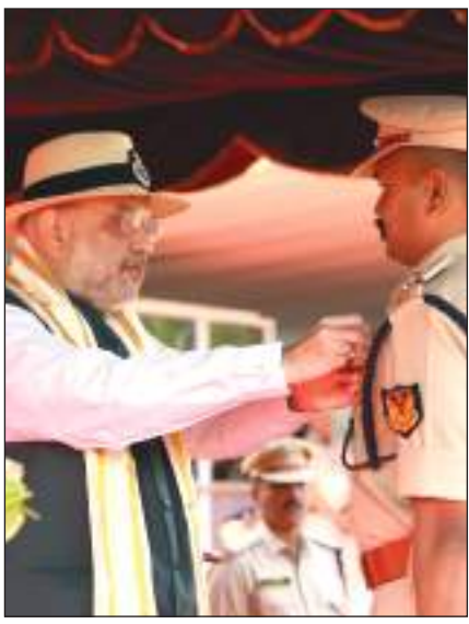
केंद्रीय गृह मंत्री अमित शाह रविवार को हैदराबाद में सीआईएसएफ के 54वीं स्थापना दिवस परेड में शामिल हुए।