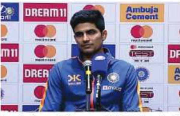
शुभमन गिल ने शतक लगाने के बाद दी प्रतिक्रिया।