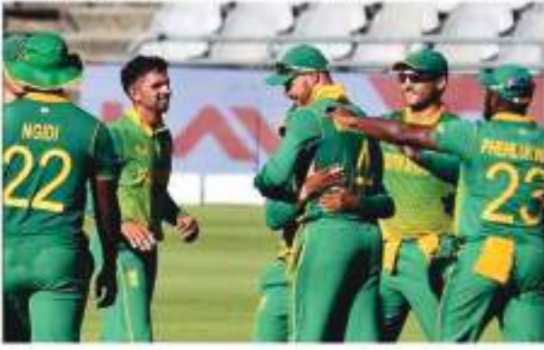
क्रिकेट दक्षिण अफ्रीका ने वर्ष 2023-24 के लिए पुरुषों के केंद्रीय अनुबंध सूची की घोषणा कर दी है।

केप टाउन। क्रिकेट दक्षिण अफ्रीका ने वर्ष 2023-24 के लिए पुरुषों के केंद्रीय अनुबंध सूची की घोषणा कर दी है। सूची में कुल 20 खिलाड़ी हैं, जिनमें कुछ नए नाम भी शामिल हैं। इस साल बोर्ड ने नए खिलाड़ियों को समायोजित करने और सफेद और लाल गेंद के चयन के लिए एक व्यापक पूल बनाने के लिए अनुबंधित खिलाड़ियों की संख्या 16 से बढ़ाकर 20 कर दी है। पिछले साल के तीन खिलाड़ी जानेमन मालन, एडिले फेह्लकवायो और डेवोन प्रिटोरियस को सूची से बाहर कर दिया गया है। इस बीच, हेनरिक क्लासेन, जिन्हें पिछले साल रिटायर नहीं किया गया था, ने वेन पार्नेल के साथ अनुबंध अपग्रेड अर्जित उनके पहले केंद्रीय अनुबंध से सम्मानित किया गया है। सीएसए युवा खिलाड़ियों के मिश्रण से वास्तव में उत्साहित हैं जिन्हें इस सीजन में अनुबंधित किया गया है, क्योंकि हम लाल और सफेद गेंद के मुख्य कोच शुकी कॉनराड और रॉब वाल्टर के नेतृत्व में एक विश्व स्तरीय टीम का गठन करना चाहते हैं। अनुबंध सूची इस प्रकार है- टेम्बा बावुमा, क्रिस्टन डी कॉक, डीन एल्गर, थ्योर्न फोर्टुइन, रीजा हॉड्जिंस, हेनरिक क्लासेन, मार्को जानसन, सिसंडा मगाला, केराव महाराज, एडेन मारकरम, डेविड मिलर, लुगी एनगिंडी, एनरिक नाट्जे, वेन पार्नेल, कीगन पोर्टमसन, कागिसो रबाडा, रयान रिक्लेटन, तबरेज शम्सी, ट्रिस्टन स्टम्ब, रासी वेन डेर ड्रुसना।