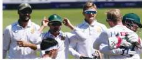
दक्षिण अफ्रीका ने जोहानिसबर्ग के मैदान पर विंडीज के खिलाफ खेले गए दूसरे टेस्ट मैच को 284 रन से जीतकर टेस्ट सीरीज में क्लीन स्विच कर लिया है।

जोहानिसबर्ग। दक्षिण अफ्रीका ने जोहानिसबर्ग के मैदान पर विंडीज के खिलाफ खेले गए दूसरे टेस्ट मैच को 284 रन से जीतकर टेस्ट सीरीज में क्लीन स्विच कर लिया है। आखिरी दिन विंडीज को जीत के लिए 390 रन बनाने थे लेकिन उनकी पूरी टीम 106 रन बनाकर ही आऊट हो गई। द. अफ्रीका ने पहला टेस्ट ऐडन माक्रम की अश्विननीय पारियों की बदौलत जीता था। दूसरे टेस्ट में द. अफ्रीका के लिए कप्तान तेम्बा बावुमा शतक बनाने में सफल रहे थे। बहरहाल, जोहानिसबर्ग टेस्ट में द. अफ्रीका ने पहले खेलते हुए 320 रन बनाए थे। एल्गर 42, ऐडन माक्रम 96 तो टोनी 85 रन बनाने में कामयाब रहे थे। विंडीज की ओर से अलजारी जोसेफ ने 60 रन पर 3, कायल मयर्स ने 32 रन पर तीन, मोटी ने 75 रन पर 3 विकेट ली थीं। विंडीज की पहली पारी मात्र 251 रन पर सिमट गई थी। हालांकि एक समय विंडीज की टीम 116 रन पर छह विकेट गंवा चुकी थी लेकिन तभी उन्हें जेसन होल्डर का साथ मिला। होल्डर ने 117 गेंदों में 81 रन बनाकर स्कोर 251 तक पहुंचाया था। चेंच 0 बनाकर फवेलियन लौट पड़ा। जेसुआ ने 34 तो होल्डर ने 19 रन बनाए लेकिन यह लक्ष्य तक पहुंचने में नाकाम थे। इस तरह विंडीज को 106 रन पर सिमेटकर द. अफ्रीका ने 284 रन से दूसरा टेस्ट और सीरीज जीत ली। प्लेयर ऑफ द मैच बने दक्षिण अफ्रीका के कप्तान टेम्बा बावुमा ने मैच के बाद कहा कि यह देखकर अच्छ लगता कि लोग शनिवार को यहाँ हमें टूर्नामेंट लेते देखने के लिए आए। मैं बहुत संतुष्ट हूँ, मैं ऐसी परिस्थितियों में रहा हूँ जहाँ टीम को पुनर्निर्माण के लिए मेरी जरूरत थी और मैं कल ऐसा करने में सक्षम था। उम्मीद है कि मैं इसे और अधिक खर कर सकूँगा।