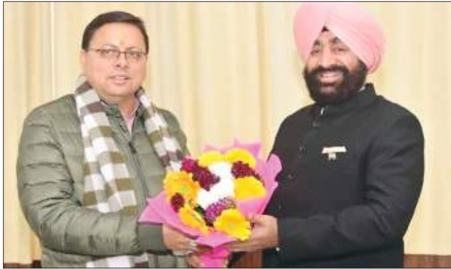
उत्तराखंड के मुख्यमंत्री पुष्कर सिंह धामी ने राज्यपाल से भेंट की। इस अवसर पर प्रदेश से संबंधित विभिन्न विषयों पर चर्चा हुई।

के कार्यक्रम और दौरे के बारे में पंजाब सरकार को पहले ही बता दिया गया था। ऐसे में नियमानुसार राज्य पुलिस को सुरक्षा के साथ-साथ अल्टरनेटिव रुट तैयार रखना चाहिए था। इमरजेंसी प्लान को देखते हुए पंजाब सरकार को सड़क मार्ग पर अतिरिक्त सुरक्षा तैनात करनी थी लेकिन ऐसा नहीं हुआ। इसी सुरक्षा चूक के बाद पीएम के काफिले ने बटिंडा एयरपोर्ट पर लौटने का फैसला किया। बटिंडा एयरपोर्ट से दिल्ली जाते हुए प्रधानमंत्री नरेंद्र मोदी ने वहां मौजूद पंजाब के अफसरों से कहा था कि सीएम से थैंक्स कहना, मैं जिंदा लौट पाया।